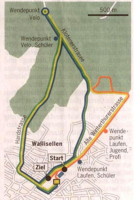
TA - Grafik kmh

— Velostrecken — Laufstrecke ■ Schwimmen ■ Wechselzone